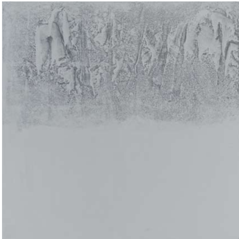
N° 16 Sans titre 2010 Encre de Chine et huile sur toile 80 x 80 cm

Photos libres de droit à télécharger: Serveur ftp://ftp.trivialmass.com/data/Anton_Meier/ ID public Password trivial