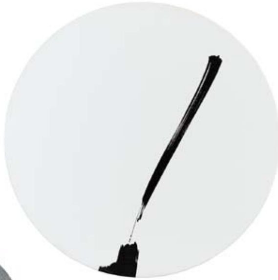
N° 09 Dyptique Sans titre 2009 Encre de Chine et huile sur toile ø 100 cm ø 150 cm