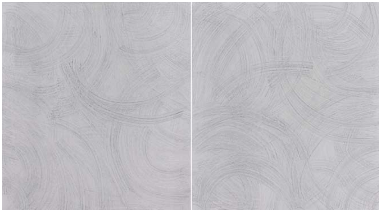
N° 01 Dyptique Sans titre 2009 Encre de Chine et huile sur toile 200 x 180 cm 200 x 180 cm